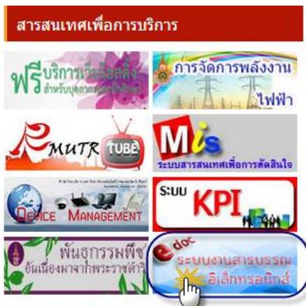
ระบบงานสารบรรณอิเล็กทรอนิกส์

❖ สารบรรณทุกท่าน สามารถเข้าเว็บไซต์สารบรรณอิเล็กทรอนิกส์ ผ่านทาง www.rmutr.ac.th ได้เลยคะ