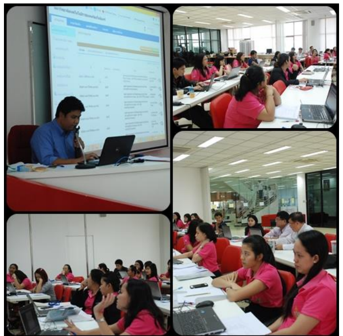
ภาพประกอบทดสอบระบบสารบรรณอิเล็กทรอนิกส์ ของกลุ่มผู้ใช้งานหลัก

✓ การนัดหมายประชุม UAT ครั้งต่อไป คือ อธิการบดีและผู้อำนวยการ ซึ่งวันเวลายังไม่ระบุชัดเจน